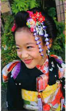
日本髪で七五三、笑顔が可愛い